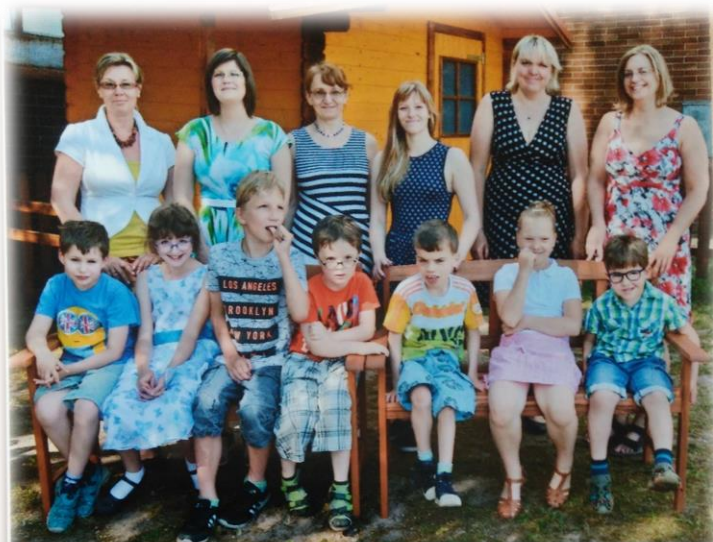
Barevná a pomerančová třída