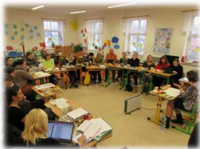
Foto ze školení Montessori principy

Principy Montessori pedagogiky Jak pracovat s osobami s PAS Celostní muzikoterapie Diakonické hodnoty Práce s tablety a ICT technikou Čtenářská gramotnost Jak zvládat zátěžové situace Rozvoj týmové spolupráce Motivace zaměstnanců