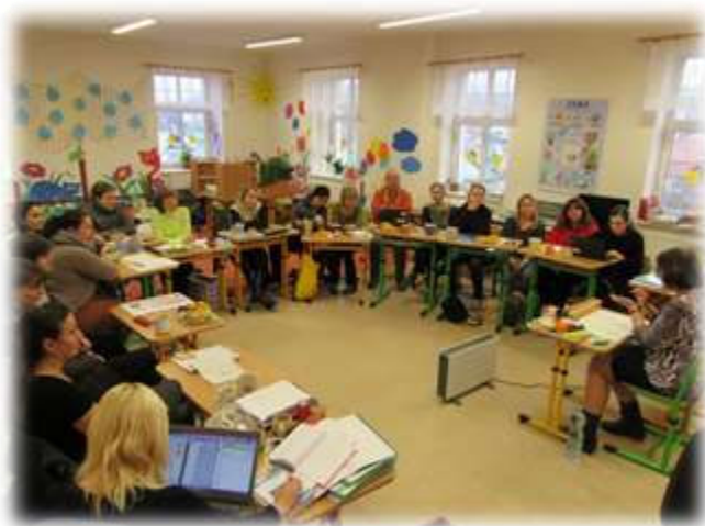
Foto ze školení Montessori principy

Principy Montessori pedagogiky Jak pracovat s osobami s PAS Celostní muzikoterapie Diakonické hodnoty Práce s tablety a ICT technikou Čtenářská gramotnost Jak zvládat zátěžové situace Rozvoj týmové spolupráce Motivace zaměstnanců